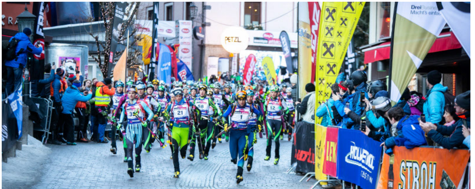
Der spektakuläre Start im Dorfzentrum von Saalbach – Auf die Felle, fertig, steil berauf!